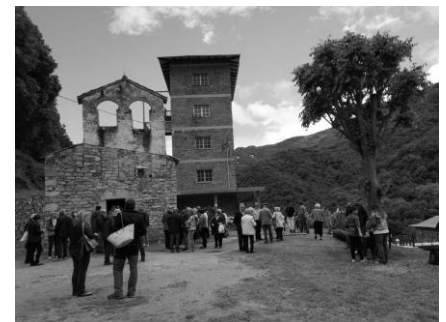
Ofrena a Sant Miquel de Maifré