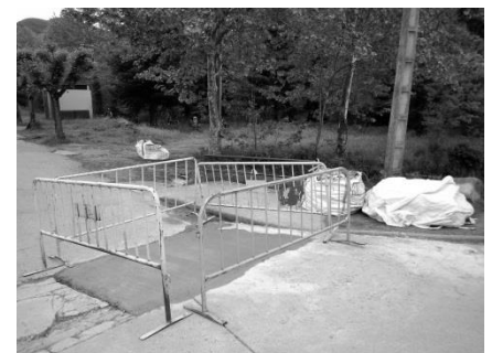
Arranjament Plaça de Les Escoles