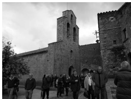
Aplec del Coll