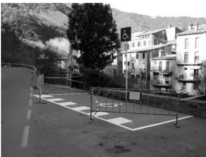
Nova zona d'aparcament