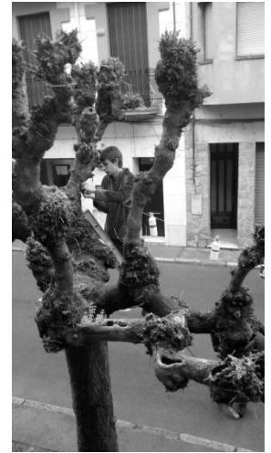
Voluntari decorant el poble