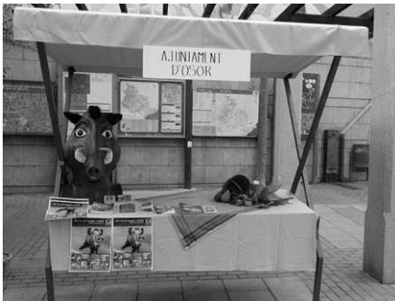
Parada de l'Ajuntament a la Fira de Les Guilleries