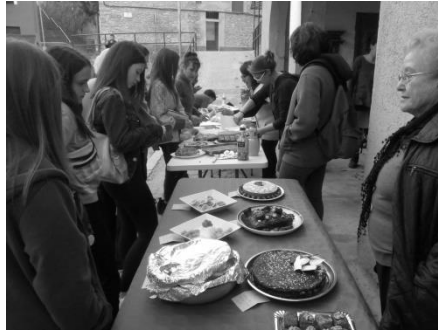
Festa de la Castanyada

16 de desembre Pastorets de l'escola La Vall 20 hores