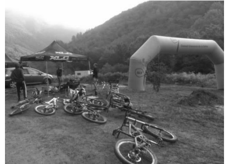
Arribada de la prova de descens