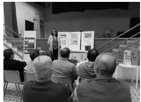
Taller sobre reciclatge a la Sala