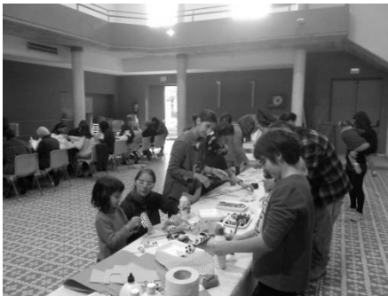
Taller d'ornaments de Nadal