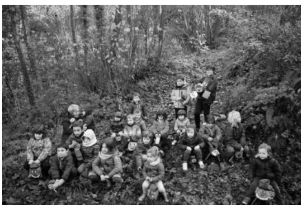
Anem a buscar el Tió

* Les despeses derivades d'aquestes activitats han estat sufragades amb els diners cobrats pels regidors i regidores del grup UFO.